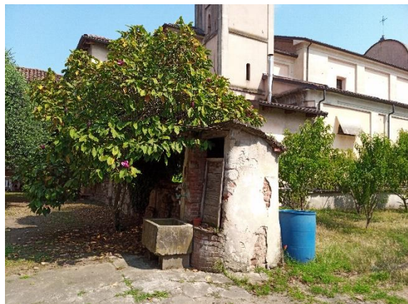
Dettaglio del cortile interno del PuntoLibro.

Un ringraziamento particolare a tutti coloro che hanno dedicato tempo libero e hanno donato libri, offerte e materiali vari. Altrettanto grati siamo verso i nostri carissimi lettori e frequentatori del PuntoLibro. Questa iniziativa è dedicata a loro.